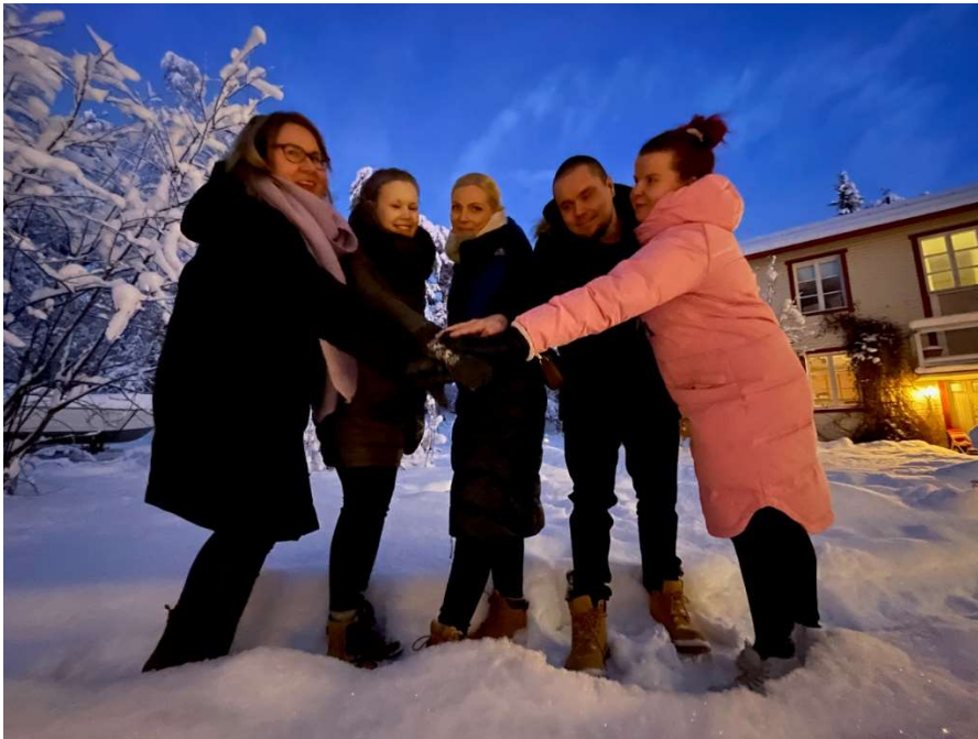
Kuva joulukuussa 2022, jossa osa ELO:n työntekijöistä

Työntekijät osallistuivat erilaisiin koulutuksiin muun muassa ensiapukoulutukseen ja verkostokonsulttikoulutus. ELO kustansi työntekijöiden kouluttamisen. Yhdistys huolehti työntekijöiden työhyvinvoinnista TYHY-suunnitelman mukaisesti järjestämällä muun muassa työntekijöille TYHY-päivät, tarjoamalla liikuntasetelit ja järjestämällä säännöllisen työnohjauksen.