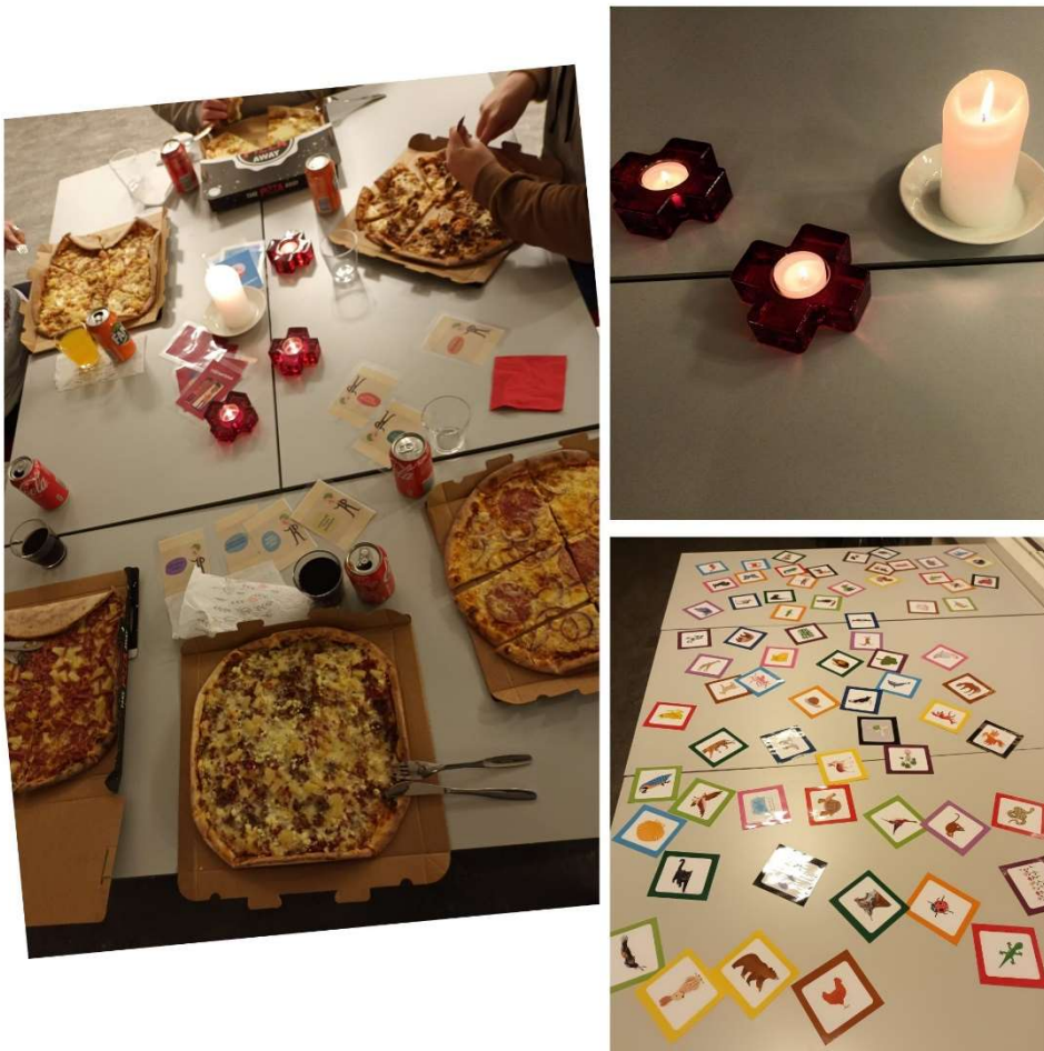
Kuvia Neppari -hankkeen ryhmistä

Perheitä kohdattiin ja toiminnasta kerrottiin vierailemalla esimerkiksi koulun ja kodin päivissä, vanhempainillassa ja tapahtumissa. Hanke sai näkyvyyttä myös paikallislehden juttukokonaisuudella. Asiakkaita ohjautui hankkeen pariin sekä itsenäisten yhteydenottojen kautta että ammattilaisten ohjaamina. Yhteistyötahoilta saatiin perheiden yhteystietoja perheiden luvalla ja pystyttiin ottamaan heihin ensikontakti puhelimitse. Tämä madalsi ja nopeutti osaltaan kynnystä osallistua toimintaan.