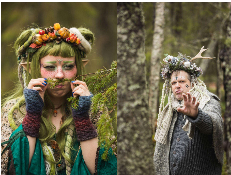
Metsän voima -valokuvatapahtuman malleja

Metsän voima -valokuvanäyttely oli esillä vuoden aikana Lapin kunnissa ja arvioitiin, että 2200 henkilöä on nähnyt näyttelyn ja valokuvien taustoista kertovan lehtiartikkelin. ELO:n toimintaa on markkinoitu erilaisissa yleisötapahtumissa ja oppilaitosten hyvinvointitapahtumissa, vuoden aikana markkinointia tehtiin 38 tapahtumassa ja kohdattiin 2010 kävijää. Edellisenä vuonna markkinointitilaisuudet tavoittivat 1056 kävijää.