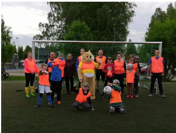
Kuvassa ELO:n joukkue ystävyysottelusta

Vanhemmille toteutui keväällä ELOnaisten virkistysviikonloppu ja syksyllä omaishoitajien tiedonsaantia, voimavaroja ja vahvuuksia tukeva OVET-valmennus. Marras-joulukuussa vuosi huipentui ensin Mahapaha -teatteriesitykseen ja sitten joulumieltä nostattaviin kuntien joulutapahtumiin. Rovaniemellä ELO hyödynsi jälleen Tallitontun pihaa, jossa perheet nauttivat joulun taianomaisesta tunnelmasta joulupuuron, glögin, tilan eläinten ja mäenlaskun siivittämänä. ELO:nallekin oli paikalla lapsia ilahduttamassa.